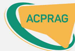
Tipo e Isotipo